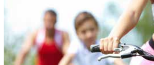
Inspanningen voor wegen en fietspaden p.3