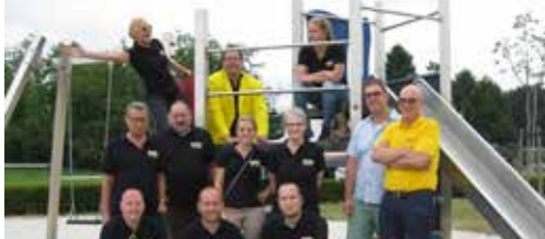
Speelpleintjes zijn belangrijk p.2