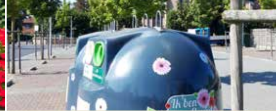
Werk maken van een proper Oud-Turnhout (p. 3)