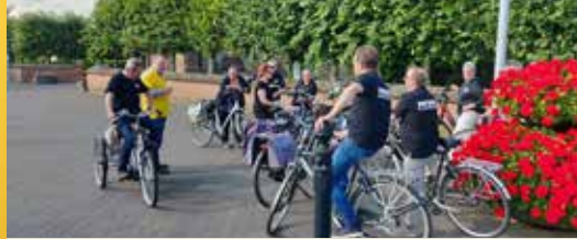
N-VA fietst op Vlaamse feestdag (p. 2)